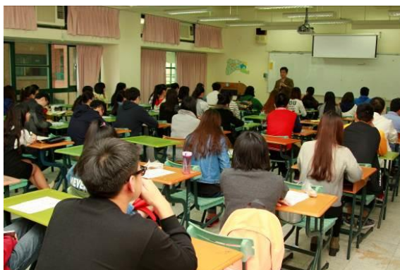
大陆短期研习生欢迎座谈会