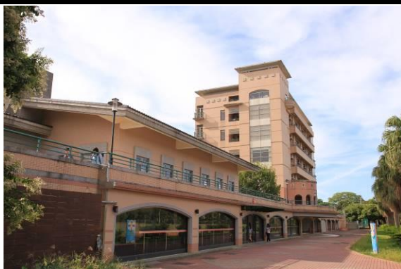
宿舍外观 / 学生餐厅外观