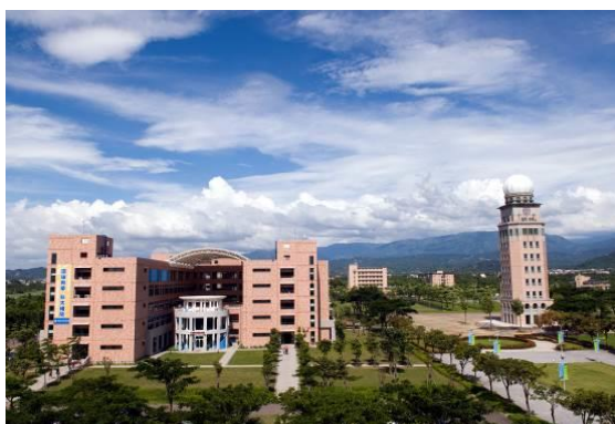
环球科技大学校园景色

健康学院设置「生物技术系」、「幼儿保育系」、「运动保健与防护系」及「生物技术系硕士班」并结合通识教育中心及体育教学研究中心。健康学院涵盖健康科技产业特色的各个领域，并结合健康科技相关产业规划课程。本院发展愿景为以强化身心灵之健康为主轴，落实保健科技，实践生命教育，提升人文素养与营造热情活力，强化谋职与创业能力，建构做中学、学中做之学习环境。