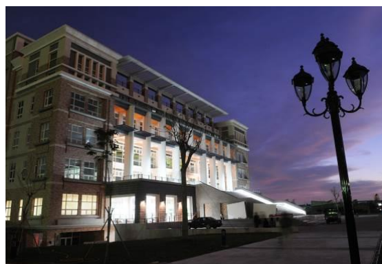
环球科技大学图书馆