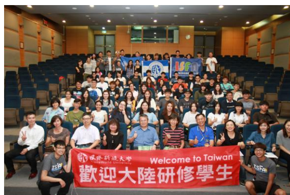
大陆短期研习生欢迎式活动