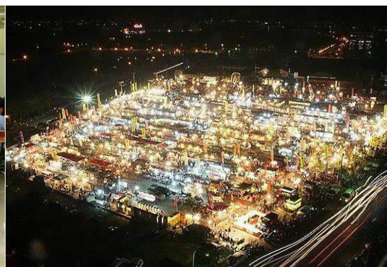
斗六人文观光夜市