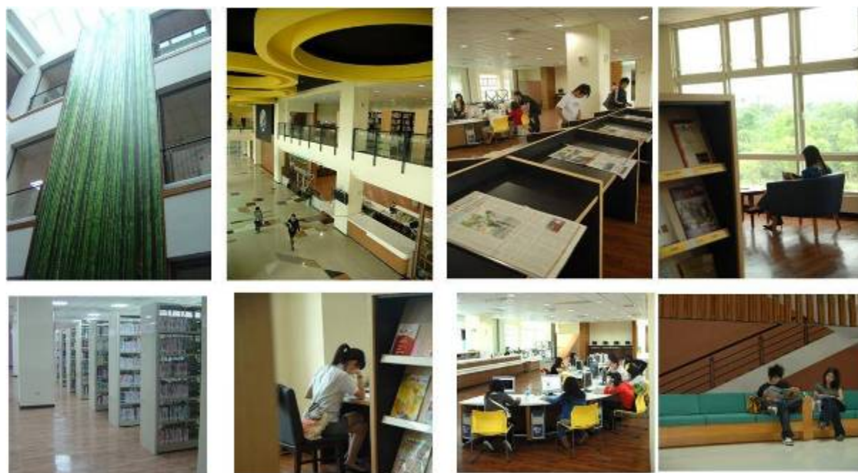
丁東德先生紀念圖書館

截至2010年9月1日為止，本館總藏書量計中文圖書188,037冊、西文圖書35,623冊，共計223,660餘冊；紙本期刊共有國內外中西文512餘種(含贈刊)；裝訂期刊16,874多冊、報紙11種、視聽資料6,429餘件；中西文資料庫共計65幾種。